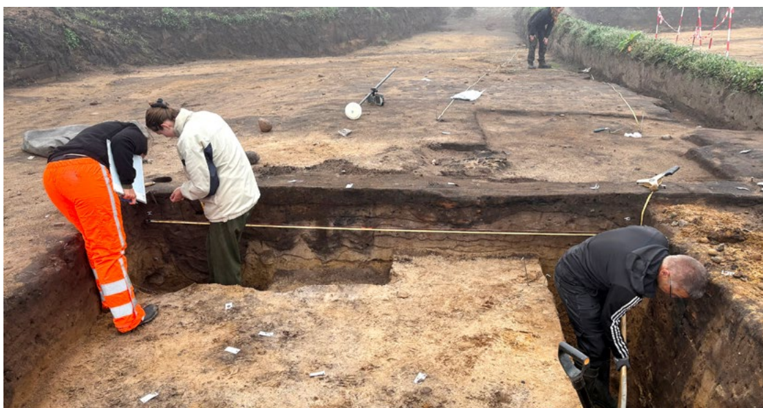
Templet set gennem gulvet og tagbærende stolper.

Her er det meget synlig hvorledes det yngste tempel er rykket cirka 75 cm mod nord i forhold til